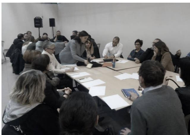
Atelier avec les commerçants