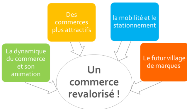
Schéma présenté lors des assises