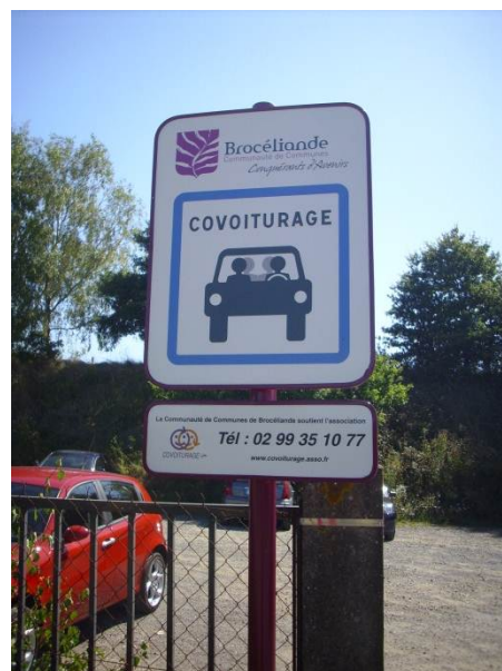
Aire de covoiturage sur le territoire de la Communauté de Communes de Brocéliande