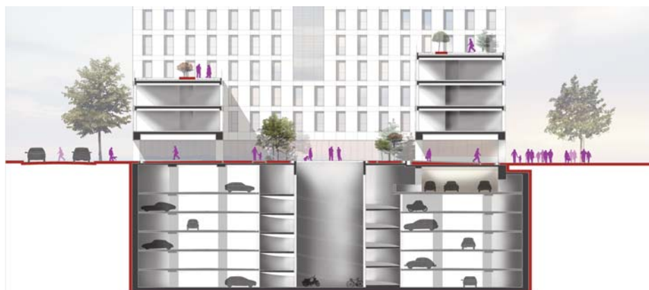
Ateliers 2/3/4/ pour le compte de Cirmad Prospectives - Nantes Métropole

La mutualisation du stationnement s'avère une réponse très concrète à ce déséquilibre. Elle consiste :